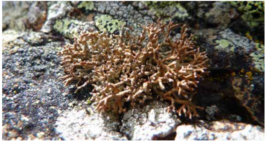
Sphaerophorus fragilis , une espèce rare.

À l'inverse, le lichen pulmonaire ( Lobaria pulmonaria ), un des rares lichens relativement connus des naturalistes, a été redécouvert grâce à l'enquête dans les départements de l'Allier, de la Loire, de la Haute-Loire, et, hors Massif central, en Dordogne. Dans ces quatre départements, il n'avait pas été mentionné depuis 1959 (voir la carte ci-dessous).