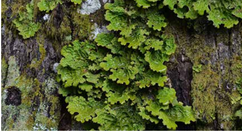
Un lichen pulmonaire ( Lobaria pulmonaria ).