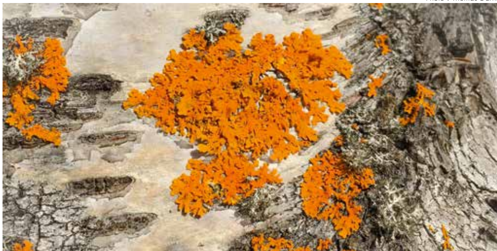
Xanthoria parietina , l'une des huit espèces cibles de l'enquête.

Dans un précédent numéro du Courrier de la Nature (cf. n° 297, p. 14-16), les auteurs du présent article avaient présenté les objectifs et les modalités de l'enquête participative sur les lichens forestiers du Massif central que la DREAL Auvergne-Rhône-Alpes et ses partenaires ont lancée en septembre 2015 a . Sur la base d'un protocole très simple, tous les volontaires pouvaient alors recenser les lichens, leur type de support et leur abondance. La phase de collecte des données étant aujourd'hui terminée, il est à présent possible de découvrir les premiers résultats marquants. L'analyse des données se poursuivra tout au long du premier semestre 2017. À l'issue de celle-ci, une publication scientifique devrait livrer l'ensemble des résultats et, espérons-le, permettre une amélioration sensible des connaissances sur les espèces cibles de l'enquête sur le territoire du Massif central.